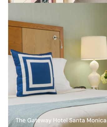
The Gateway Hotel Santa Monica

Pour plus d'options d'hébergement à Santa Monica, envisagez les établissements suivants, qui vous accueilleront chaleureusement :