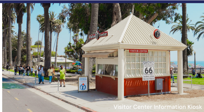
Visitor Center Information Kiosk

Terminez votre journée par un souper classique en bord de mer au restaurant The Lobster , où vous pourrez déguster des fruits de mer frais tout en admirant le magnifique coucher de soleil sur le Pacifique. À la tombée de la nuit, retournez au Pier de Santa Monica, où les néons des jeux et des manèges historiques du Pacific Park font revivre la nostalgie de la Route 66. Montez à bord de la seule grande roue au monde fonctionnant à l'énergie solaire, faites un tour sur le West Coaster ayant pour thème la Route 66 et profitez de l'atmosphère animée de la promenade. Terminez votre journée par un dernier verre au Chez Jay, un bar historique légendaire imprégné de l'histoire de la Route 66, où les icônes hollywoodiennes se sont longtemps retrouvées autour d'un verre pour partager leurs anecdotes.