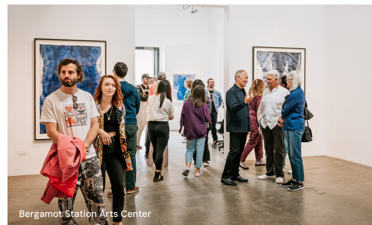
Bergamot Station Arts Center