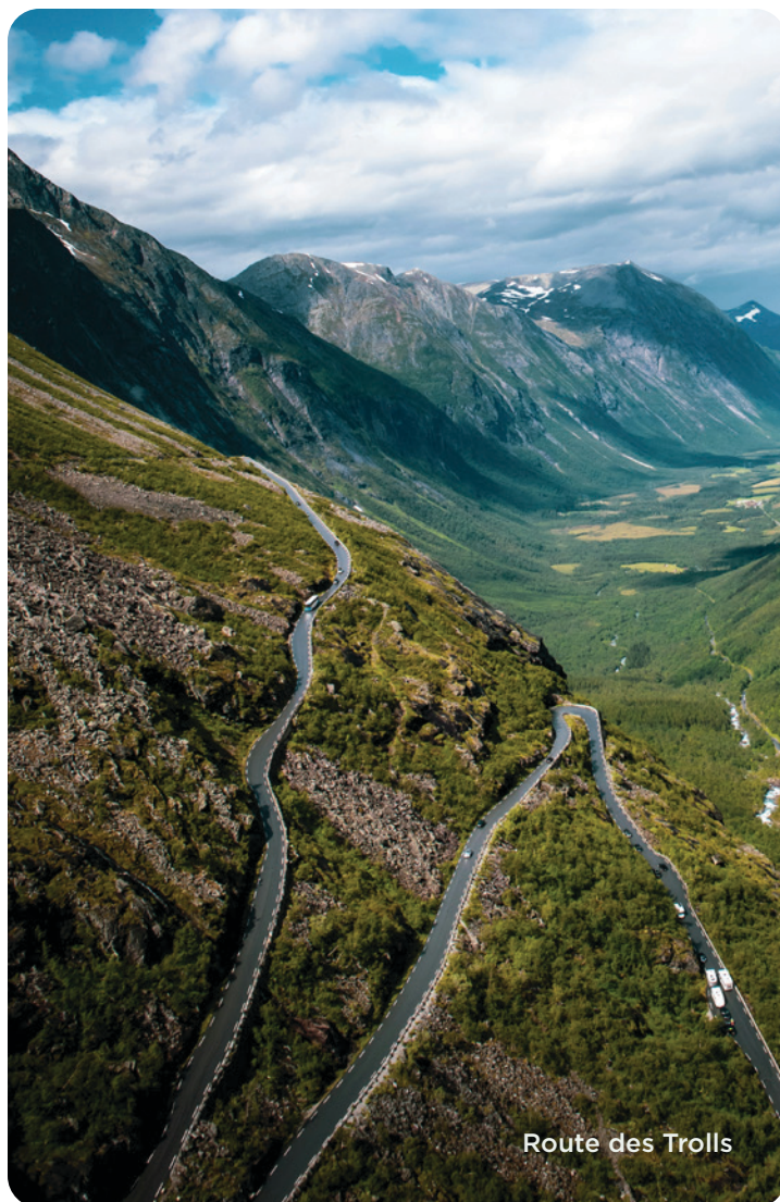
Route des Trolls

Selon l'horaire de vol, transfert vers l'aéroport d'Oslo. Vols avec correspondance vers Montréal. (PD)