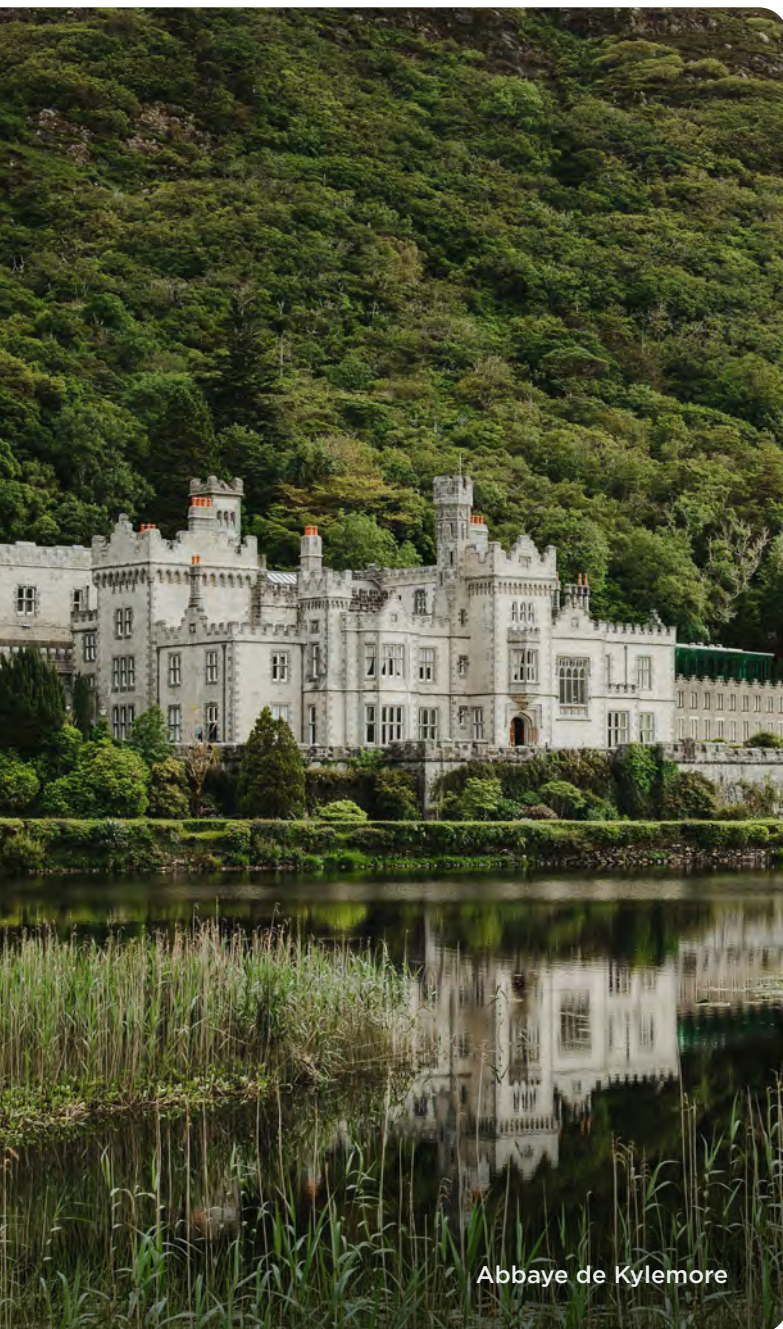
Abbaye de Kylemore

de rabais par personne avec un paiement par chèque ou argent comptant