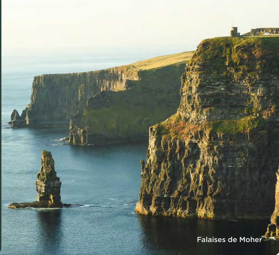
Falaises de Moher

Plongez dans un voyage inoubliable qui vous fera découvrir l'histoire, la culture et les paysages enchanteurs de l'Irlande. Des majestueux châteaux aux falaises spectaculaires, en passant par les villes vibrantes et les villages pittoresques, chaque étape réservera une expérience unique. Vous découvrirez des traditions authentiques, des saveurs locales et des panoramas à couper le souffle. Vous serez captivé par la beauté intemporelle de l'île d'émeraude.