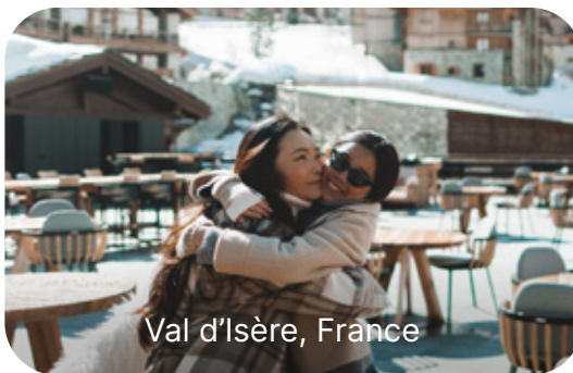
Val d'Isère, France