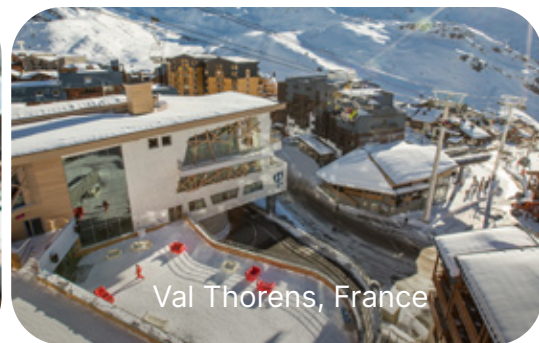
Val Thorens, France

Fenêtre de réservation : Platine / Or : du 2 au 6 février 2026 | Fenêtre de voyage : Du 22 novembre 2026 au 1er mai 2027