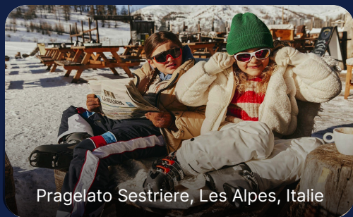
Pragelato Sestriere, Les Alpes, Italie