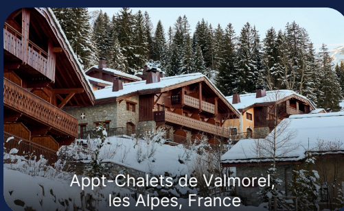
Appt-Chalets de Valmorel, les Alpes, France