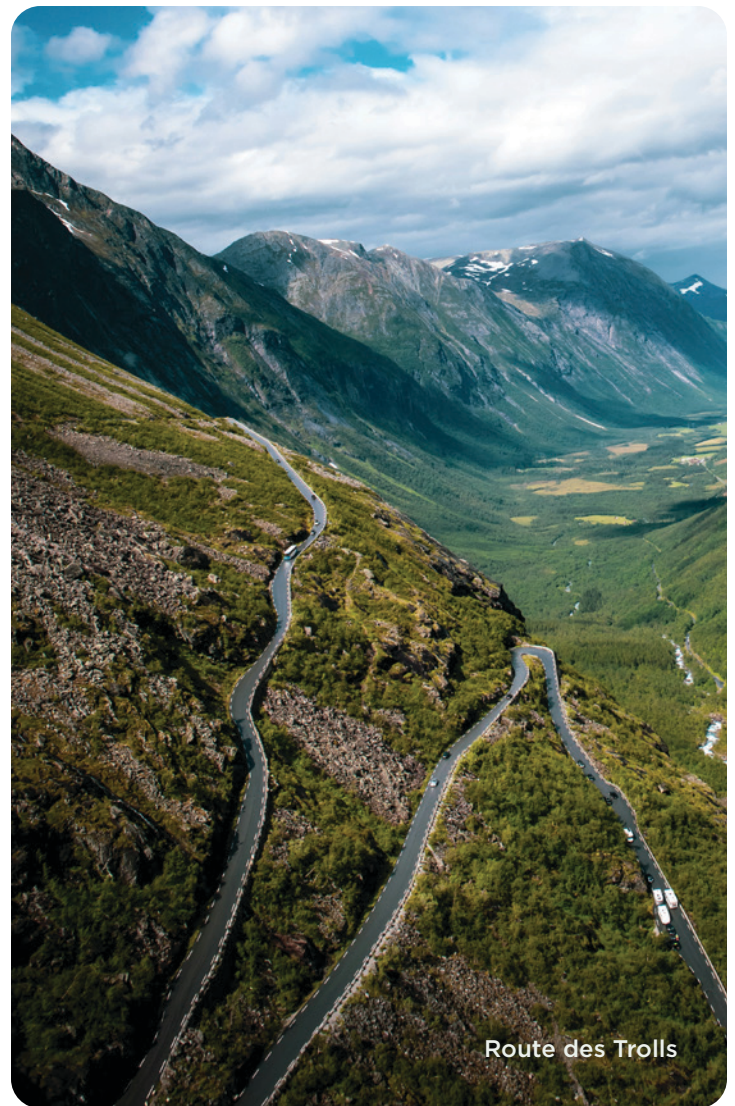
Route des Trolls

Selon l'horaire de vol, transfert vers l'aéroport d'Oslo. Vols avec correspondance vers Montréal. (PD)