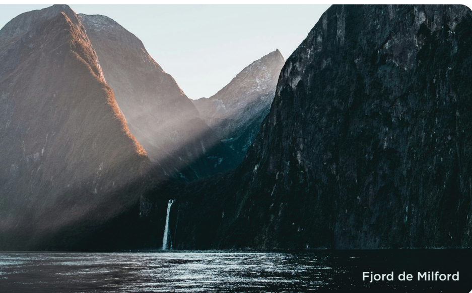
Fjord de Milford