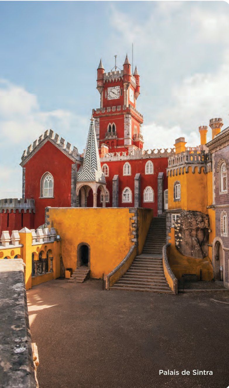
Palais de Sintra

de rabais par personne avec un paiement par chèque ou argent comptant