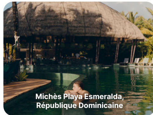
Michès Playa Esmeralda, République Dominicaine

Fenêtre de réservation : Du 22 au 29 avril 2025 | Fenêtre de voyage : Du 29 Mars au 1er Novembre 2025 (libération de la chambre le 1er Novembre 2025)