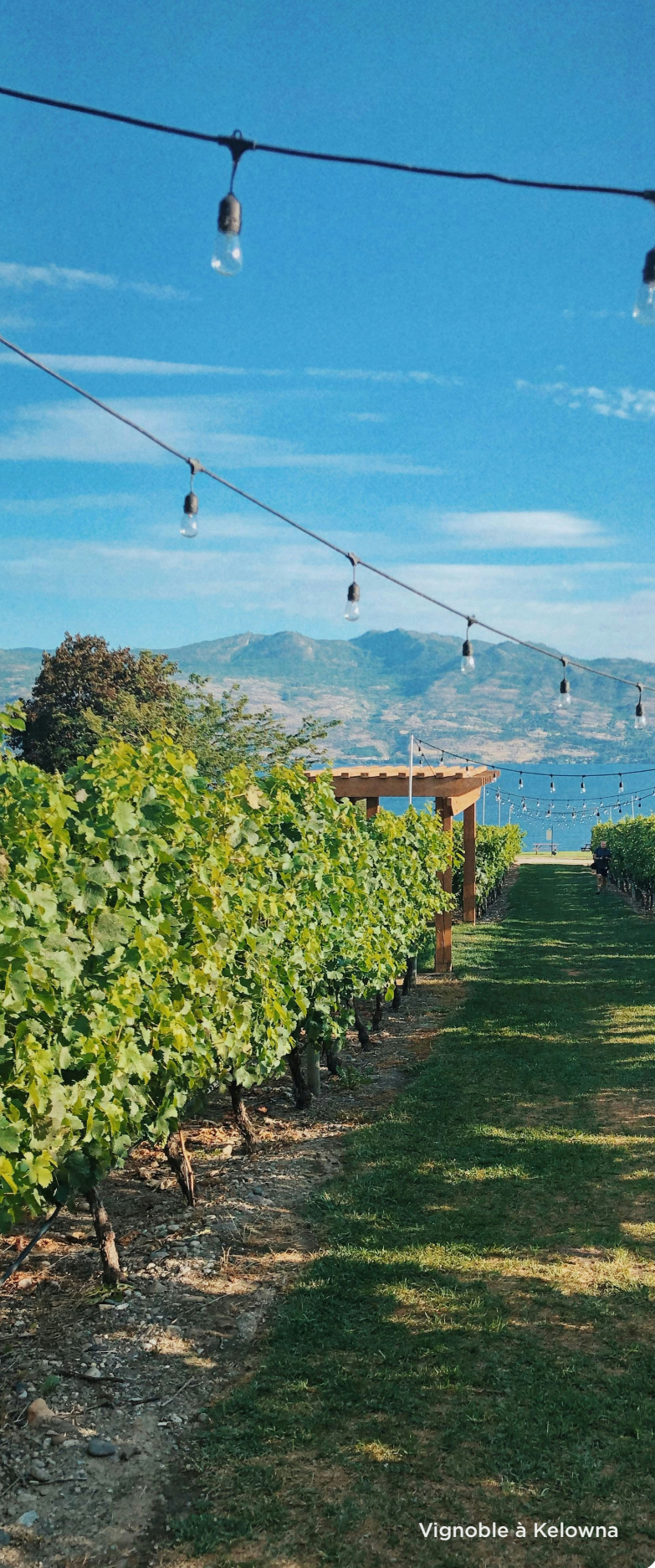
Vignoble à Kelowna