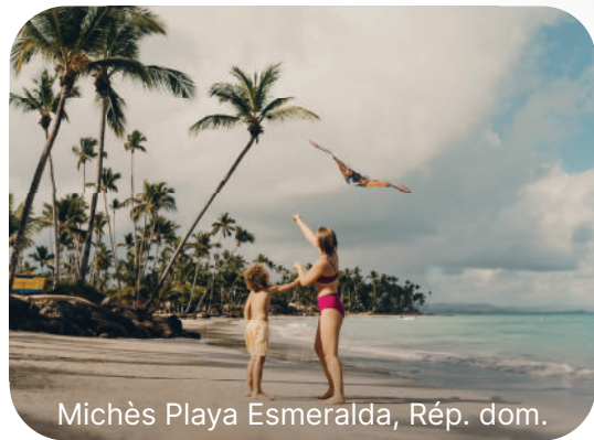
Michès Playa Esmeralda, Rép. dom.