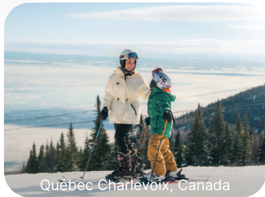
Québec Charlevoix, Canada

Fenêtre de réservation : 19 novembre au 2 décembre 2024 | Fenêtre de voyage : 7 décembre au 27 juin 2025