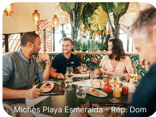
Michès Playa Esmeralda - Rép. Dom