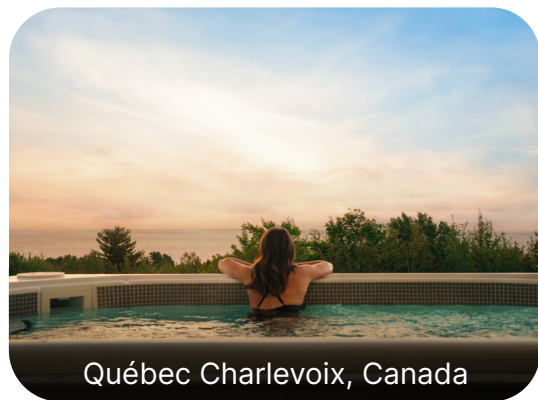
Québec Charlevoix, Canada